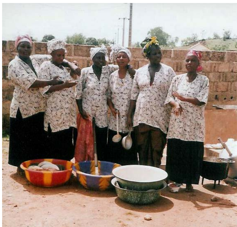
Vår duktiga kökspersonal som utspisar 360 barn varje skoldag

OBS Se kallelsen till årsmötet på tidningens baksida OBS