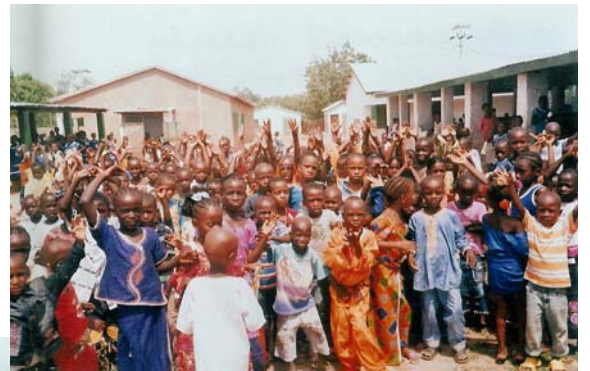
Festen med dans i full gång.