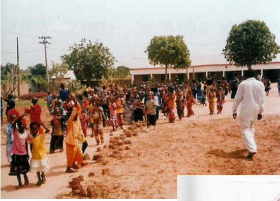
Barnen på väg till festen