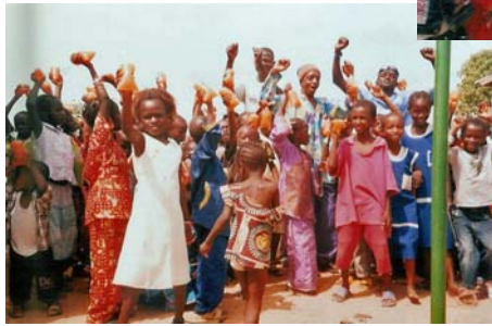
"Tack för idag!"