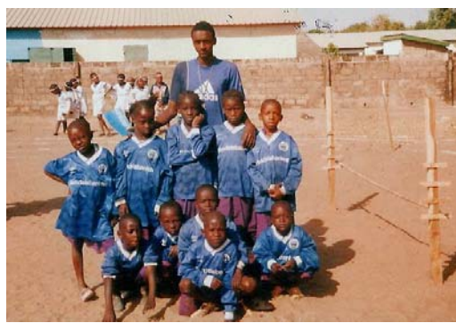
Kaba Kama team