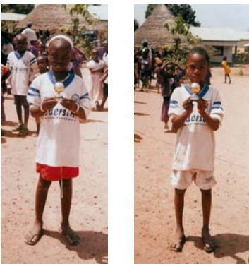
Pris till bästa "kvinnliga" och "manliga" idrottare.

Den andra stora dagen på året är idrottstävlingen mellan våra skolor.