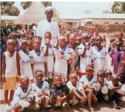
Manneh Kunda team