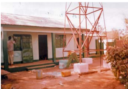
"Sovhuset" för dagisbarnen (3-4 år)