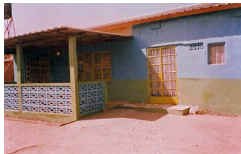
Gästhuset i Mansajang

En eloge till våra duktiga grabbar (som vi skrev om på förra sidan) för deras målningsarbete.