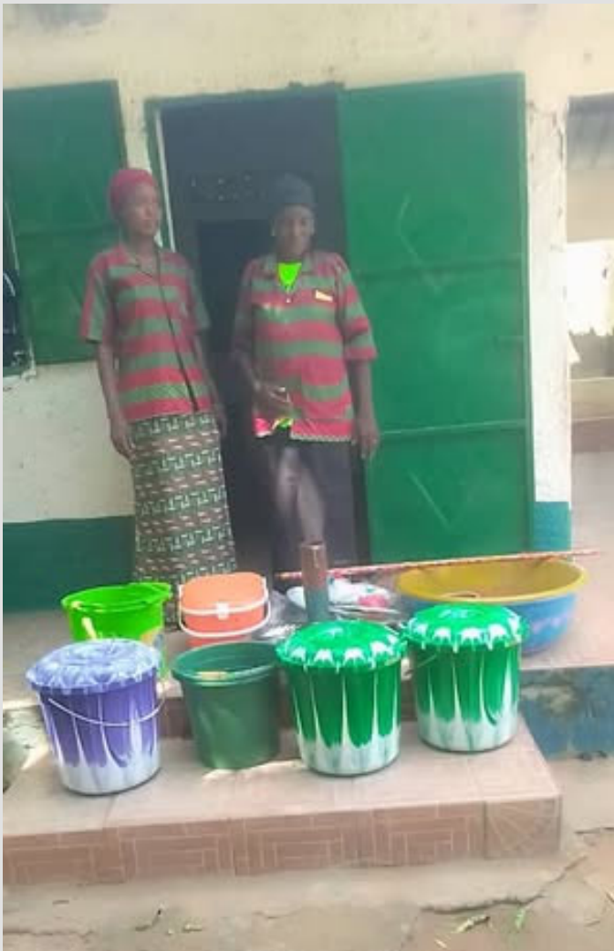
Inför skolstarten har ny köksutrustning köpts in till CHIGAMBAS tre förskolor. CHIGAMBAS kokerskor gör ett fantastiskt arbete med att servera våra 300 barn varm mat varje dag.